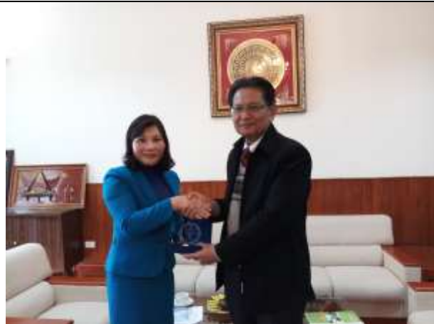
Penyerahan kenang-kenangan oleh Kepala LPPM IPB kepada Direktur National Institute of Animal Science (NIAS) Vietnam