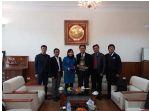
Foto bersama Tim LPPM IPB dengan Tim National Institute of Animal Science (NIAS) Vietnam