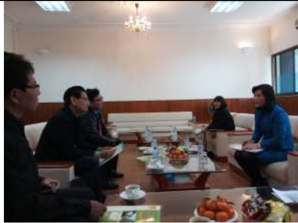
Diskusi Tim LPPM IPB dengan Tim National Institute of Animal Science (NIAS) Vietnam